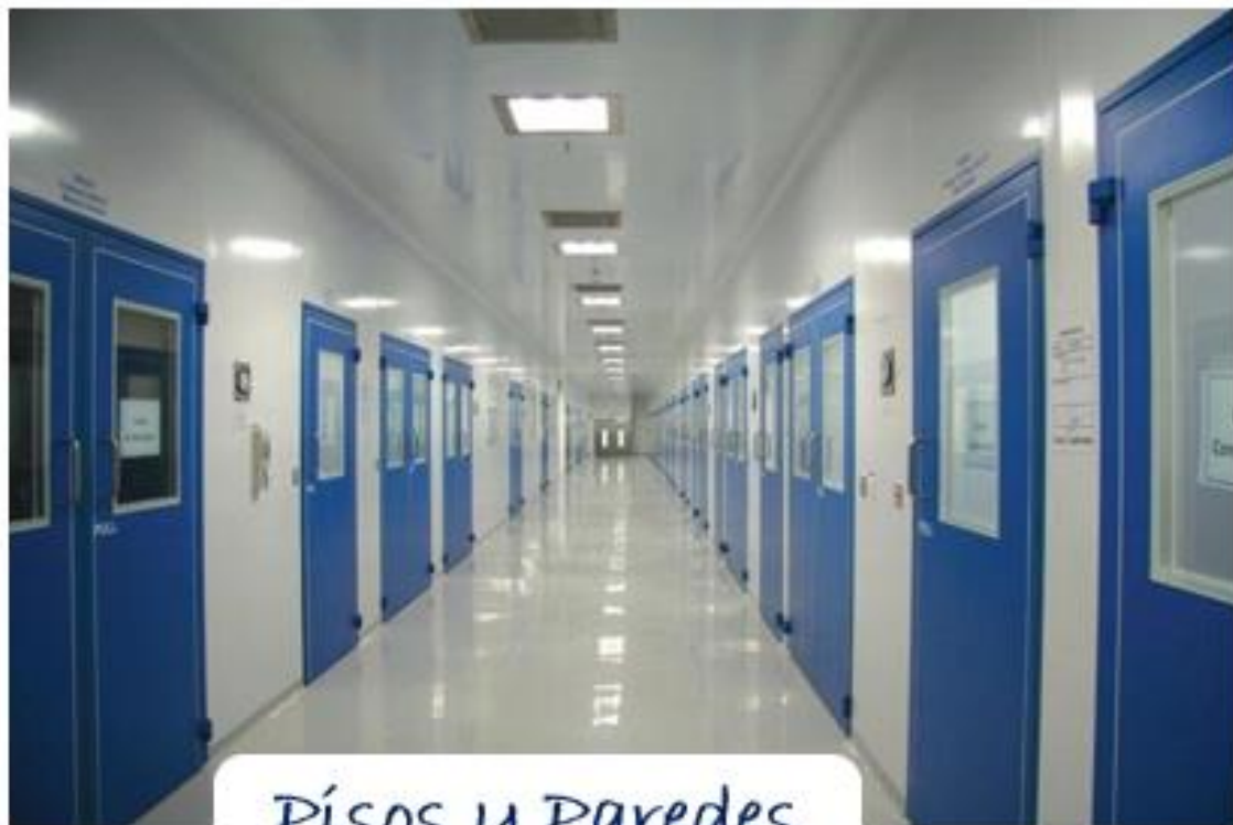
Pisos y Paredes